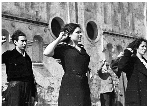
Arriba, fotograma de 'El trabajo o a quién pertenece el mundo' de la lavianesa Elisa Cepedal. Abajo, un momento del largometraje 'Vaca mugiendo entre ruinas' de Ramón Lluis Bande. Dos de las cintas que se proyectarán en Langreo durante la programación de la Cinemateca Ambulante