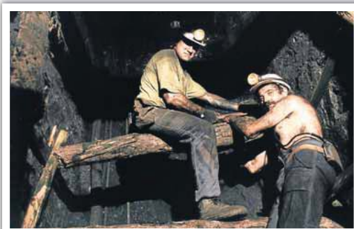
Dos mineros, durante una jornada laboral.