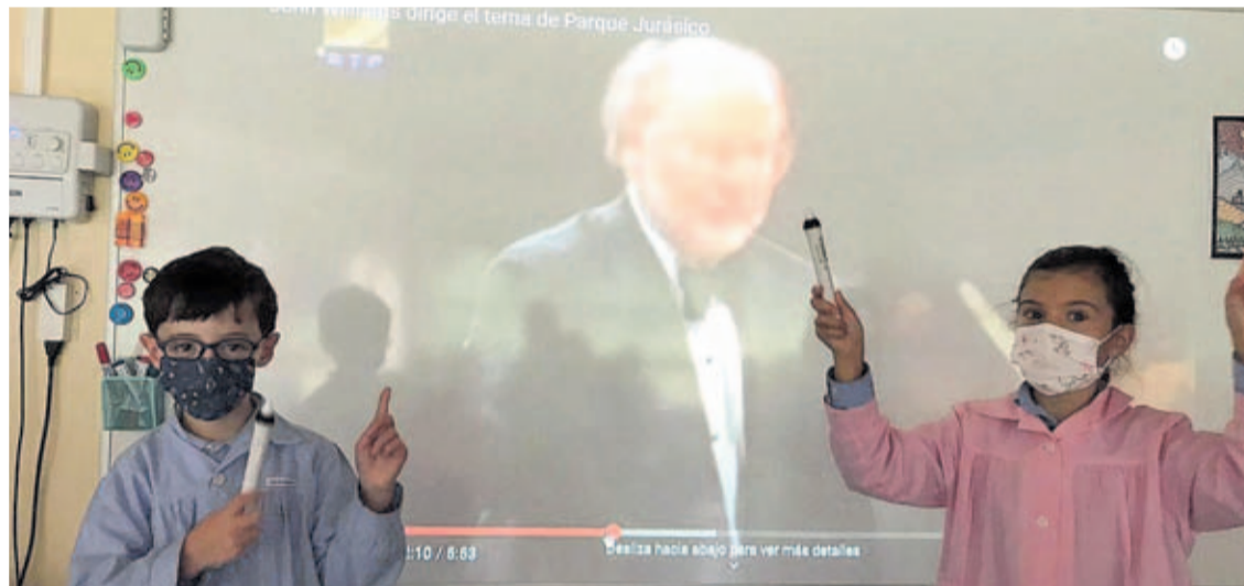
Dos alumnos, ante la imagen del compositor John Williams.

tante, tomando como base el famoso cuadro “Guernica” de Pablo Picasso, los alumnos de 6.º han plasmado a través de dibujos sus sentimientos durante el confinamiento.