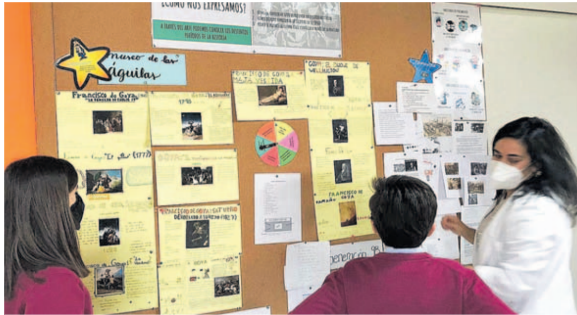
Dos estudiantes, con una profesora ante un mural.