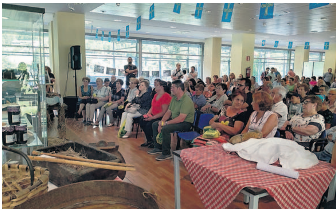
El salón de actos de la residencia, lleno para una actividad sobre el panchón este mes de agosto.